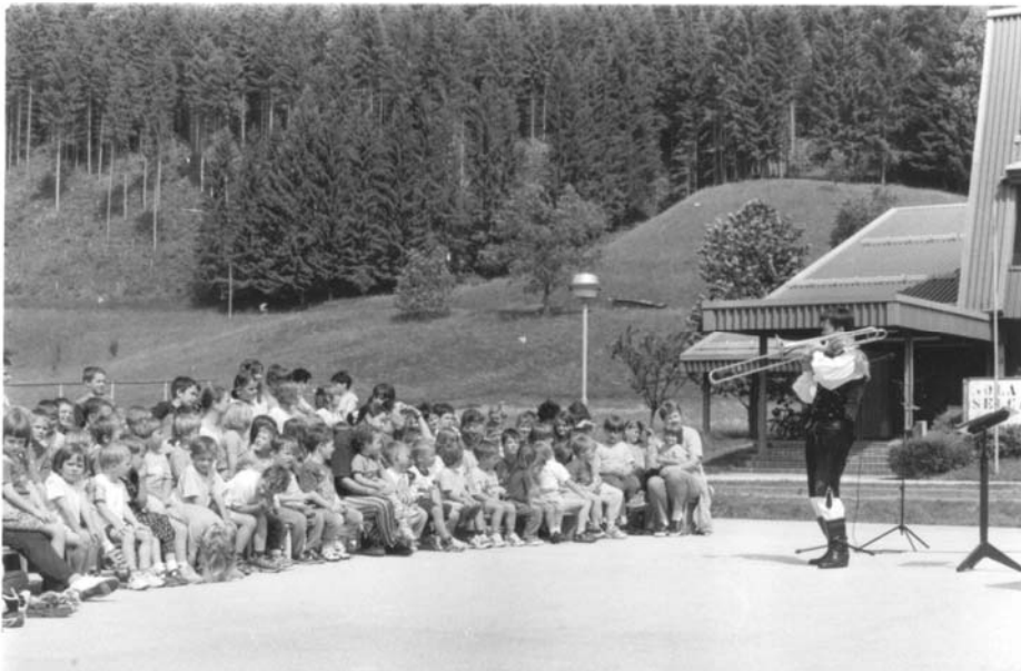
Slika: v Selcih za najmlajše

Z Glasbeno šolo Škofja Loka smo se začeli dogovarjati, da bi tudi v Železnikih začeli poučevati instrumente za potrebe pihalnega orkestra, še posebej trobila, ki smo jih v orkestru najbolj potrebovali. Mi bi pri tem pomagali tako, da bi vsako leto v Osnovni šoli Železniki organizirali koncert za učence, jim predstavili Orkester in instrumente ter jih tako navdušili za igranje. Prvi tak koncert smo izvedli aprila 1997. Na avdicijo se je prijavilo 20 učencev in pet izmed njih jih je začelo obiskovati glasbeno šolo, kasneje pa pričelo z igranjem v orkestru. S takšnimi predstavitvenimi koncerti še sedaj vsako leto pridobivamo nove godbenike in učence dislocirane enote glasbene šole v Železnikih.