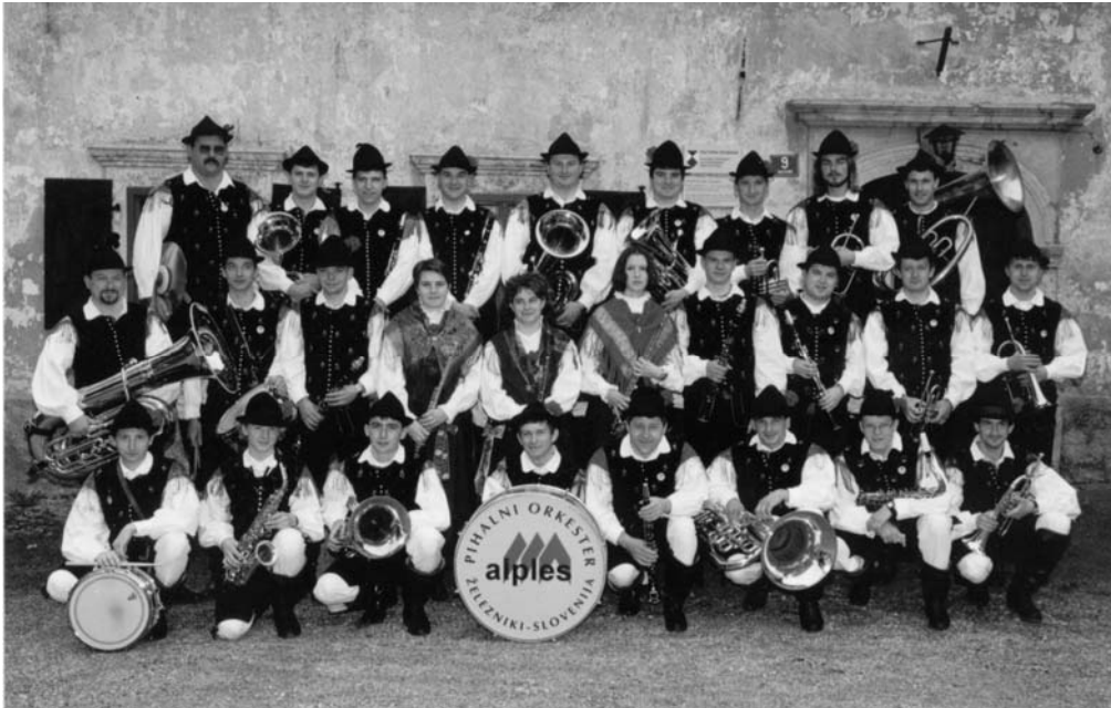
Slika: 20 let

Ob praznovanju 20. obletnice delovanja smo v Pihalnem orkestru Alples Železniki izpeljali dve prireditvi; koncert ter srečanje pihalnih orkestrov. Na jubilejnem koncertu 25. junija v kinodvorani na Češnjici, je bila tudi podelitev bronastih in srebrnih Gallusovih značk za dolgoletno delo v ljubiteljski glasbeni dejavnosti. Repertoar je bil v glavnem sestavljen iz skladb, ki so bile posnete na kaseti in zgoščenci, saj je bil koncert hkrati promocija našega novega izdelka.