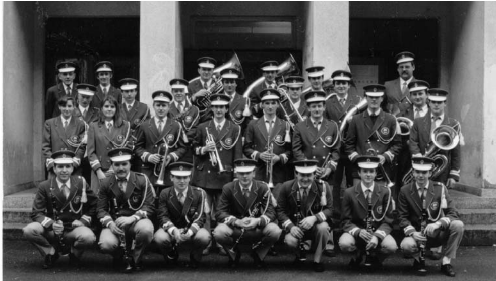
Slika: 10. obletnica