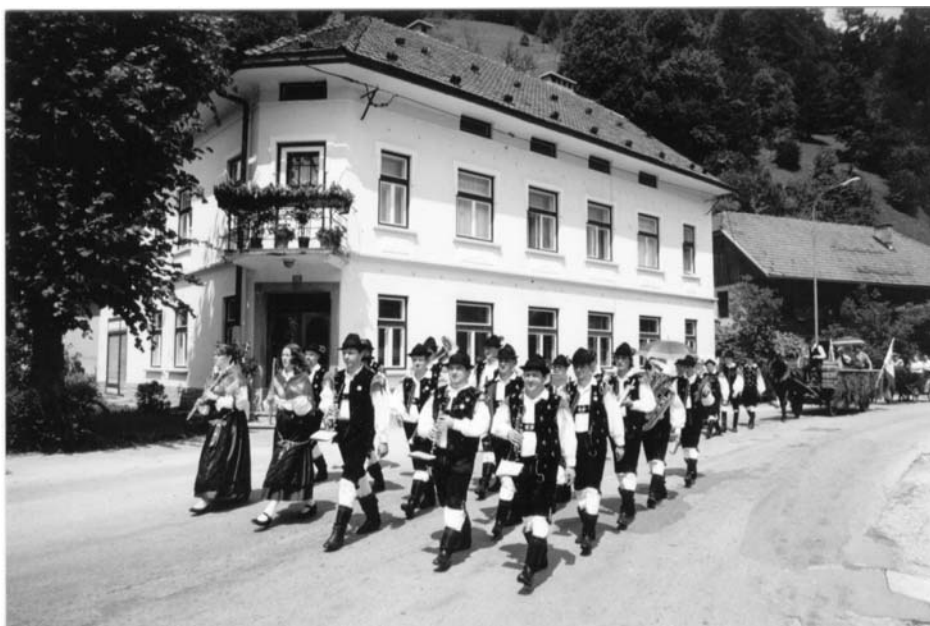
Slika: čipkarska povorka