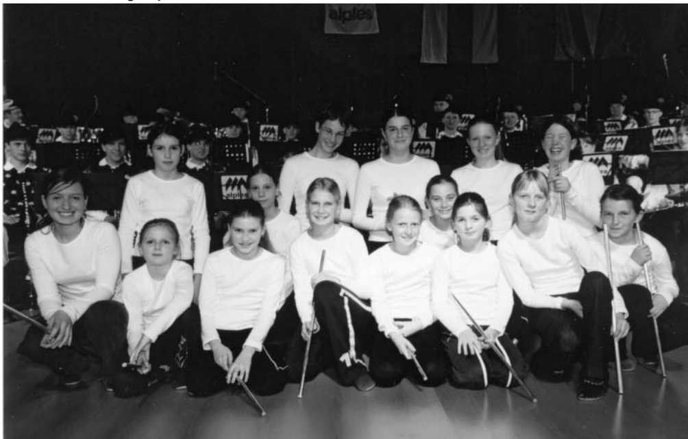
Slika: prvi nastop mažoretk

Piko na i so delu v tem letu dale »neglasbene aktivnosti«. Zaključili smo z obnovo prostorov in na našo pobudo ustanovili Mažoretno društvo. Odslej bodo nekatere naše nastope s svojimi plesnimi vložki popestrile mažorete. Spretnosti si je oktobra začelo nabirati 18 deklet. Ker želimo povečati zanimanje otrok za glasbo, smo zanje v šolskem letu 2003/04 organizirali glasbene delavnice, ki jih obiskuje približno 45 otrok. V Orkestru smo začeli razmišljati dolgoročno in zato pripravili strateški načrt orkestra za obdobje 2004 – 2007, ki pri finančnih obveznostih vključuje tudi Občino. Pripravljenost za sodelovanje pri uresničevanju zamisli, zbranih v načrtu, nam je izkazal tudi župan, s podpisom pisma o nameri sodelovanja. Strateški načrt nam daje večje možnosti za uspešno sodelovanje na razpisih Javnega sklada za kulturne dejavnosti Republike Slovenije, ki je v letu 2003 s finančnimi sredstvi že podprl nekatere naše projekte.