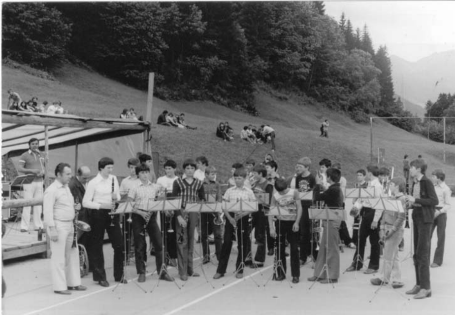
Slika 2: Prvi nastop