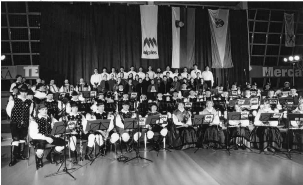
Slika: z božično novoletnega koncerta

Orkester je kmalu po ustanovitvi začel z organiziranjem vsakoletnega samostojnega koncerta. Najprej je bil ob praznovanju slovenskega kulturnega praznika, v zadnjih letih pa na Štefanovo, 26. decembra. Božično-novoletni koncert je postal naš »zaščitni znak«. Zadnji dve leti smo ga priredili v novozgrajeni športni dvorani v Železnikih in vedno imeli okoli 900 poslušalcev. Repertoar sestavljajo božične in koncertne skladbe ter skladbe drugih žanrov. Da pa prireditve še obogatimo, med nas povabimo zanimive goste. Obiskovalcem želimo z glasbo pričarati čar praznikov in jih vsaj za nekaj trenutkov popeljati od vsakdanjega sveta.