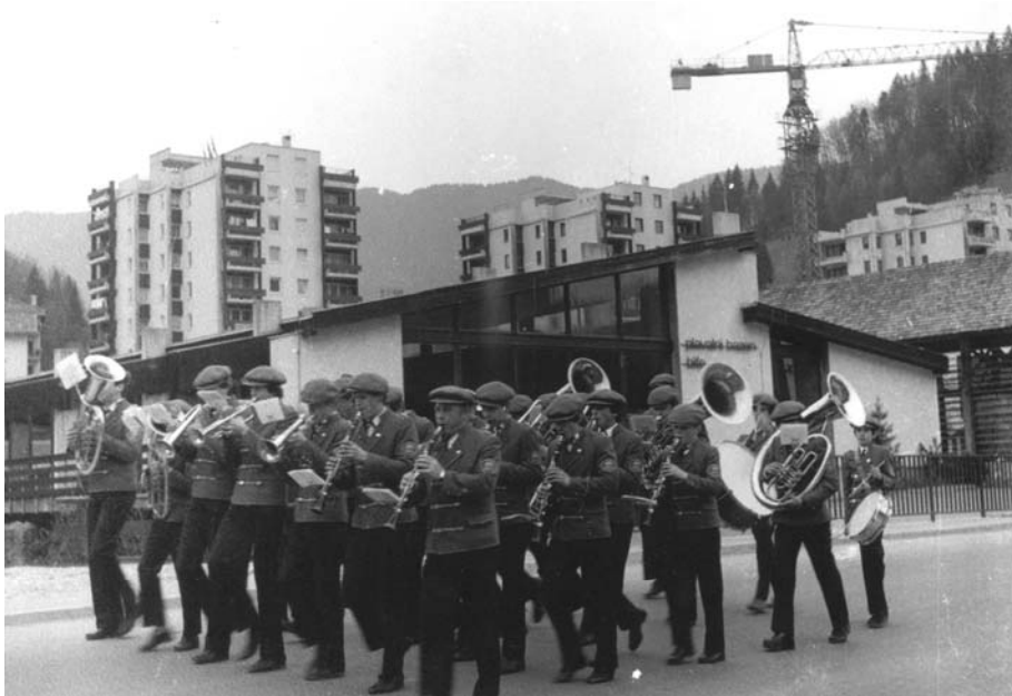
Slika: prva budnica