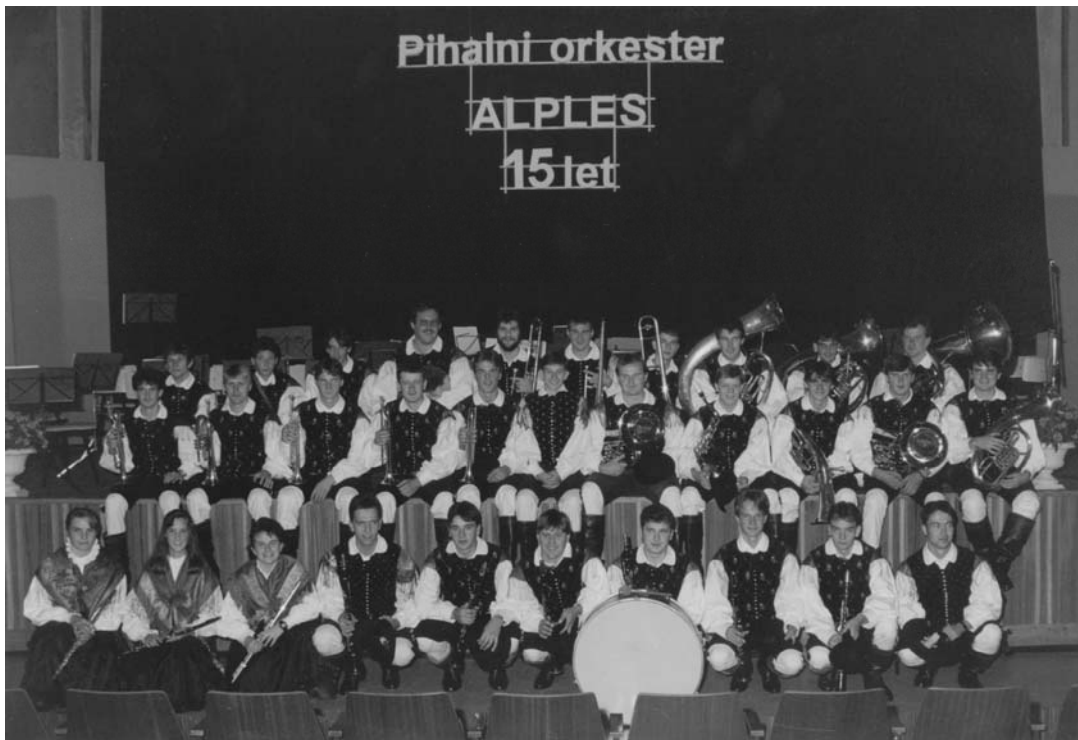
Slika: 15. obletnica

V nedeljo 18. septembra sta bili na praznovanje povabljeni Godba Gorje in Trebanjski pihalni orkester. Slednji se je v zadnjem hipu opravičil in tako sta bila koncert ter parada izvedena le z Gorjansko godbo. Zanimivo je bilo opravičilo Trebanjskega pihalnega orkestra. Njihov telegram se je glasil: