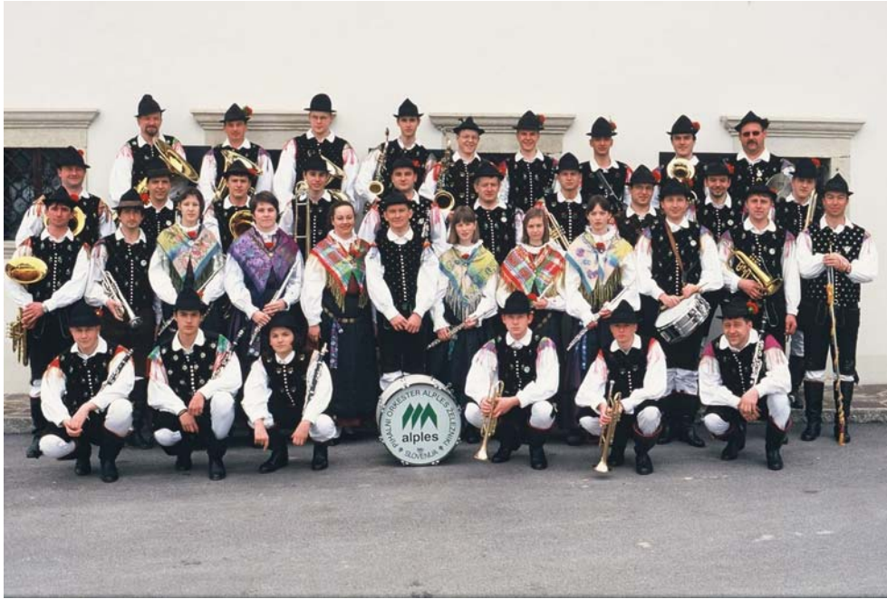
Slika: 25 let